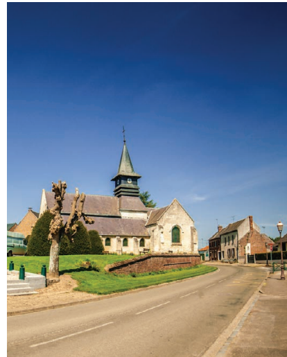
Église Saint-Léger, Offoy

N'hésitez pas à venir partager ce moment de convivialité ! Organisé par le PETR Cœur des Hauts-de-France (Mission Pays d'art et d'histoire et Office de Tourisme Haute Somme).